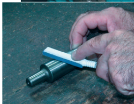
Nacharbeit auf einer Maschinen - Gleitbahn